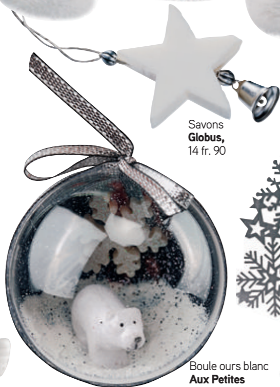
Boule ours blanc Aux Petites Babioles , 12 fr.