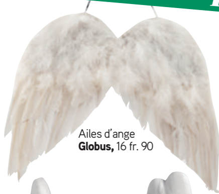
Ailes d'ange Globus , 16 fr. 90