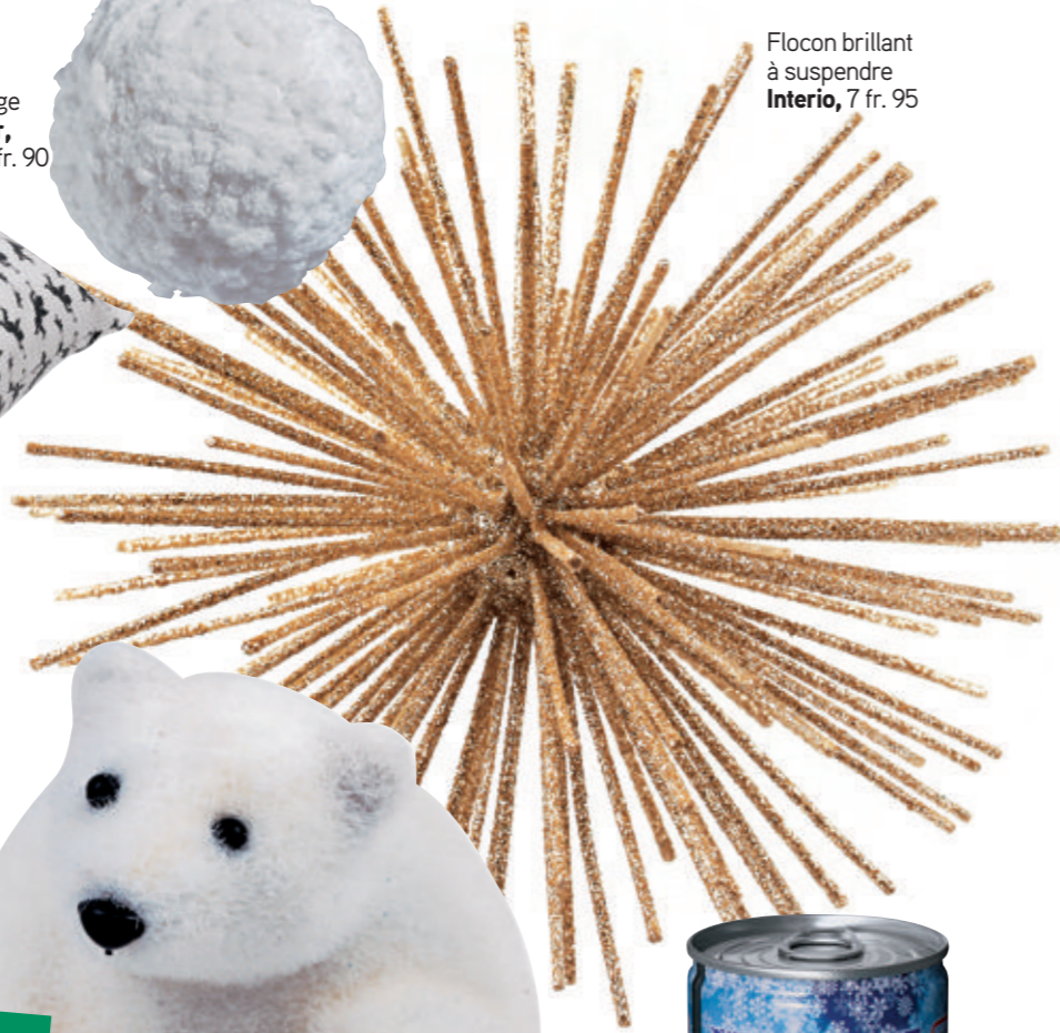
Flocon brillant à suspendre Interio , 7 fr. 95