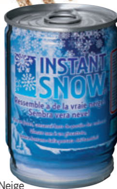
Neige en boîte Manor , 7 fr. 90