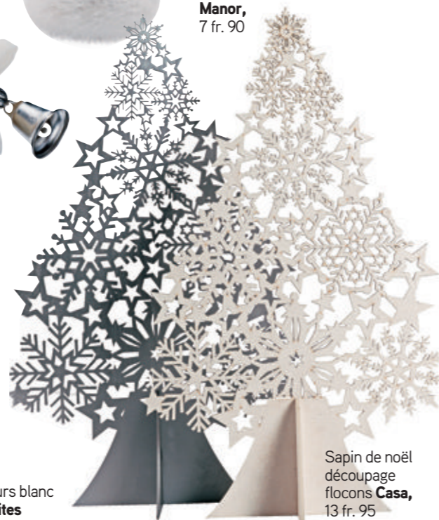
Sapin de Noël découpage flocons Casa , 13 fr. 95