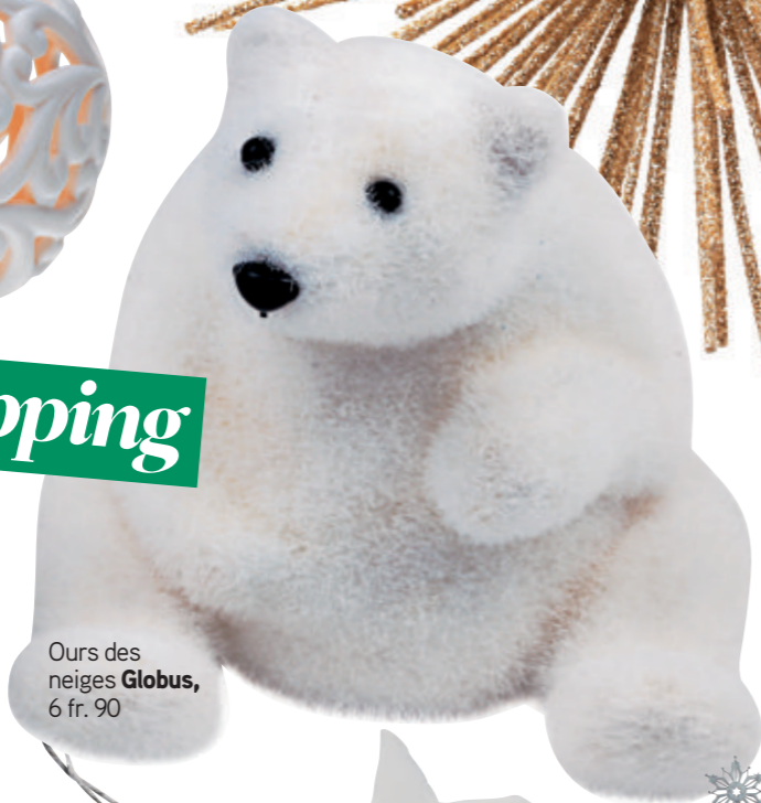
Ours des neiges Globus , 6 fr. 90