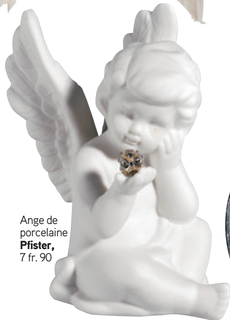
Ange de porcelaine Pfister , 7 fr. 90